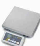
Wägeplatte A 315 x 305 mm

Justierprogramm CAL Prüfgewichte gegen Mehrpreis