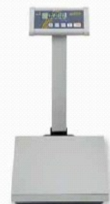
Stativ zum Hochsetzen des Anzeigeräts, Stativhöhe ca. 450 mm.