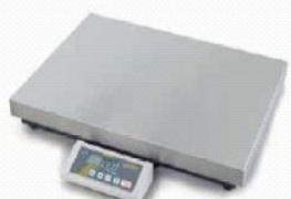
Wägeplatte C 650 x 500 mm